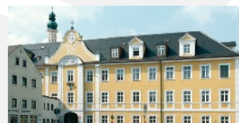
Fachakademie für Sozialpädagogik

Bismarckplatz 14, 84034 Landshut Christliches Bildungswerk Landshut e.V. Maximilianstr. 6, 84028 Landshut, Tel. 0871 / 923 17 0 info@cbw-landshut.de | www.cbw-landshut.de