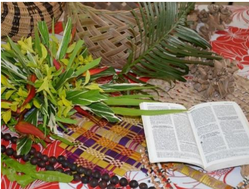
Das zweite Titelbild zum Weltgebetstag 2021 aus Vanuatu

Das Gemälde zeigt die Situation auf Vanuatu, als der Zyklon Pam 2015 über die Inseln zog (Bild: Juliette Pita). Das Bild zeigt eine Frau, die sich schützend über ihr kleines Kind beugt und betet. Die Frau trägt traditionelle Kleidung, wie sie auf der Insel Erromango – eine der Inseln Vanuatus – getragen wird. Der Sturm fegt über die Frau und das Kind hinweg. Eine Palme mit starken Wurzeln kann sich dem heftigen Wind beugen und schützt beide so vor dem Zyklon. Im Hintergrund sind Kreuze zum Gedenken an die Todesopfer des Sturms zu sehen.